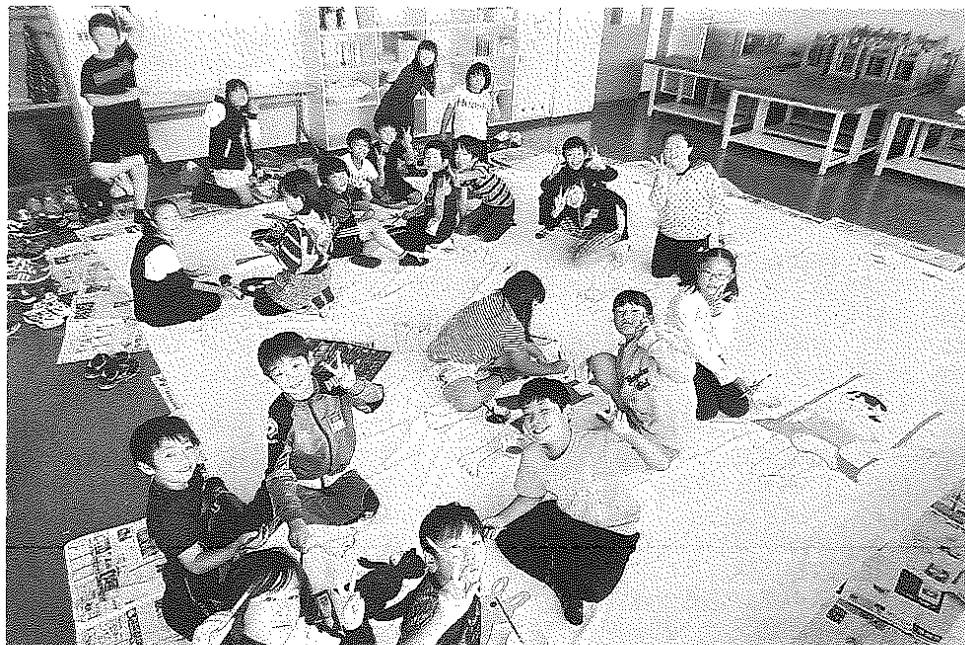
「大きな絵」を制作する士別南小の児童たち