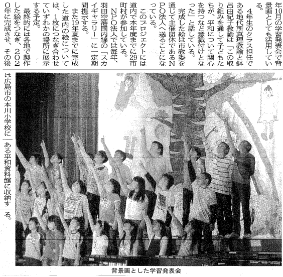
青景園とした学習発表会