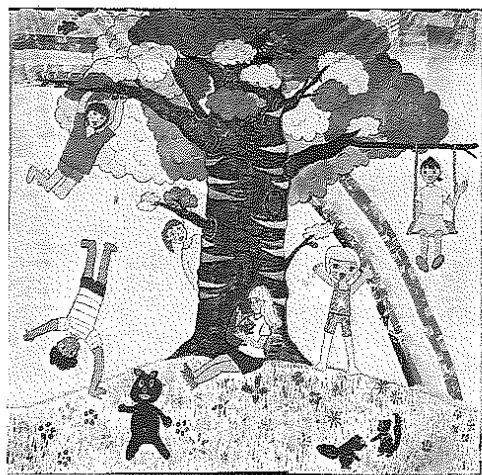
完成した大きな絵「世界はONEになる！」（同）

【士別】世界中の子供たちが描いた絵を1枚につなぎ合わせるプロジェクト「世界一大きな絵2020」に、士別南小が参加している。虹のかかった青空の下、大木の周りで各国の子供が遊ぶ姿を4年生45人が大きな木綿の布に描き、来月にも東京の主催団体に送る。（後藤耕作）