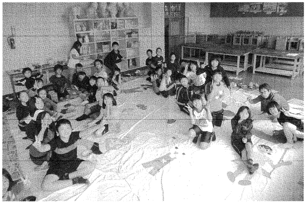
「世界一大きな絵」を描く児童たち